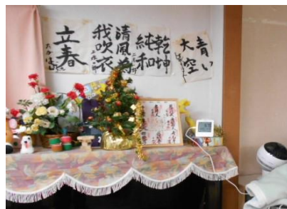
グループホーム1Fに設置