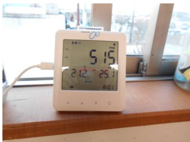
グループホーム2Fに設置

CO2モニター（二酸化炭素濃度測定器）をグループホームの食堂・リビングルーム、デイサービスのデイルーム、ケアプラン・ヘルパー事業所内に設置しました。広い室内の二酸化炭素濃度をチェック、温度、湿度も表示され、アラーム音で知らせるので適切な換気ができるようになりました。入居者・利用者、利用者家族をはじめ職員の感染拡大防止や職場内クラスター等の防止に役立っています。