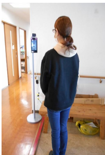
グループホームの検温の様子

サーモカメラを認知症高齢者グループホーム、デイサービス、ケアプラン・ヘルパー事業所の入り口に設置しました。入居者・利用者、利用者家族をはじめ職員が非接触型AI顔認証付サーマルカメラを使用することで、瞬時に体温測定が可能になり、検温時の手間が劇的に改善されました。ウイルスを持ち込まない、拡大させない感染対策により、安心・安全のサービス提供ができています。