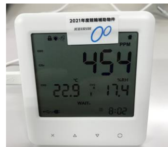
導入したCO2モニター

サーキュレーターをCO2モニターと同様にグループホームの食堂・リビングルーム、デイサービスのデイルーム、ケアプラン・ヘルパー事業所内に設置しました。広角で上下左右の首振り機能、適用床面積24畳に対応できるので、広い室内の空気の循環や換気が確実にでき、感染予防に役立っています。