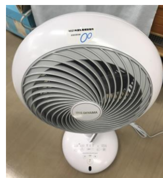
導入したサーキュレーター