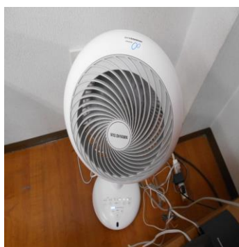
グループホーム2Fに設置

サーキュレーターをCO2モニターと同様にグループホームの食堂・リビングルーム、デイサービスのデイルーム、ケアプラン・ヘルパー事業所内に設置しました。広角で上下左右の首振り機能、適用床面積24畳に対応できるので、広い室内の空気の循環や換気が確実にでき、感染予防に役立っています。