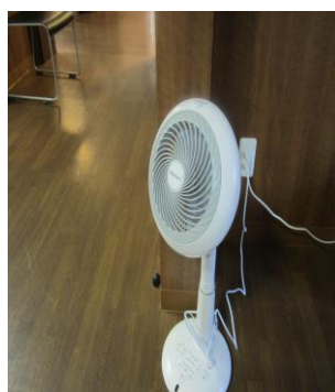
デイサービスの デイルームに設置